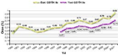
Grafik 1: Ar-Ge Harcamalarının GSYİH’ya Oranı:

*Yeni GSYİH ile hesaplanan 2006-2007 yılı değerleri için yükseköğretim kesimi Ar-Ge personel harcamalarında brüt ücretler kullanılmıştır.