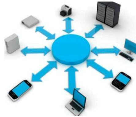
Resim 2: Mobil Platformlar Üzerinde SOA

Bu nedenlerle mobil yazılım sistemlerinde SOA'yı kullanmayı düşündüğümüzde SOA'nın mobil yazılım sistemleri üzerinde birçok avantajı olduğu görülebilir. Öncelikle SOA'nın sağlamış olduğu farklı platformların entegrasyonunu kolaylaştırma yeteneği, mobil yazılım sistemlerinin de esnek bir hale dönüşmesini sağlamaktadır. Ayrıca, SOA sayesinde farklı mobil platformlar arasında entegrasyonu sağlamak da mümkün olabilmektedir. Kısıtlı bir kaynağa sahip olan mobil cihazlar, SOA altyapısıyla kaynaklarını en iyi şekilde kullanabilen cihazlara dönüşmektedir. Örnek olarak, Instagram gibi bir fotoğraf çekme uygulamasında, mobil cihazların sadece fotoğraf çekme özelliklerinden yararlanıp diğer fotoğraf işlemleri ve sosyalleşme gibi işlemlerin tamamen servisler tarafından gerçekleştirilmesi sayesinde mobil cihazların kaynaklarını en yüksek şekilde etkin ve etkin olarak kullanmak SOA ile mümkün olmaktadır.