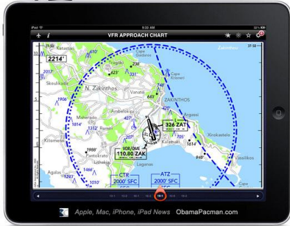
Resim 3: Elektronik Uçuş Çantası

EFB projesinde birden çok mobil platform bulunmaktadır. Mevcut kullanılan EFB yazılım sistemi; İOS, Windows 8 Mobile ve web platformları üzerinde bulunmaktadır. Bu yazılım sistemlerinin tamamen birbirlerinden bağımsız ve esnek olması en önemli yazılım geliştirme kriterlerindedir. Ayrıca, mobil platformların kısıtlarının da bir nevi üstesinden gelebilmek, EFBprojesiningerekliliklerindedir.