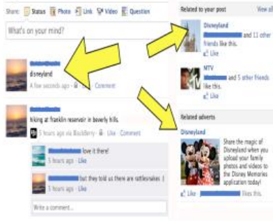
Şekil 2 Facebook İçeriğinde Veri Madenciliği Örneği

Veri madenciliğinin kullanım alanı sosyal medya ile bir adım daha öteye gitmiştir. Nitekim, günümüzde sosyal medya bir pazarlama alanı olarak kullanılmaktadır. Gerek sosyal toplum etkinlikleriyle, gerek ise kurumsal kampanyalarla, özel sektör markaları çeşitli sosyal medya kanallarıyla karşımıza çıkmaktadır. Sosyal medya üzerinden özel sektörün müşteriye ulaşımında veri madenciliği;