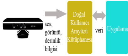
Şekil 3. Bilgi Akış Yönü

Burada yorumlanan veriler ise uygulamalara bir komut olarak iletilerek program akışı sağlanmaktadır. Bu veri akışı Şekil 3’ de gösterilmektedir.